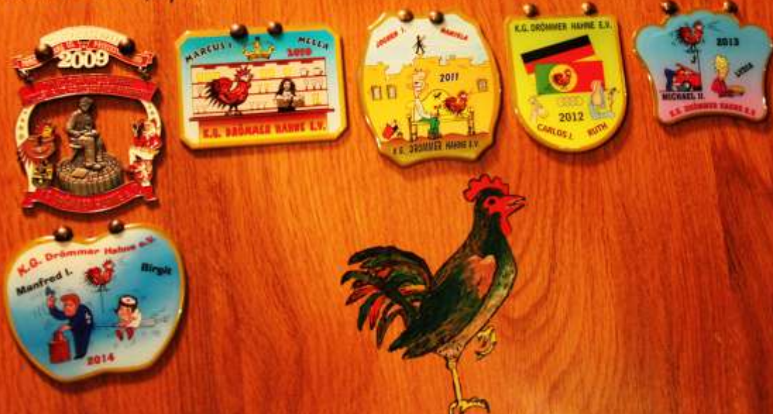
K.G. Drömmmer Hahne e.V.